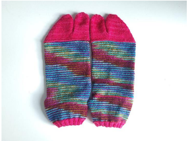
セルフストライプレギュラータビーズ・サイズ 3