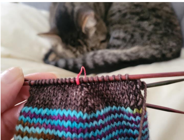
表目の右上 3 目一度を編むと