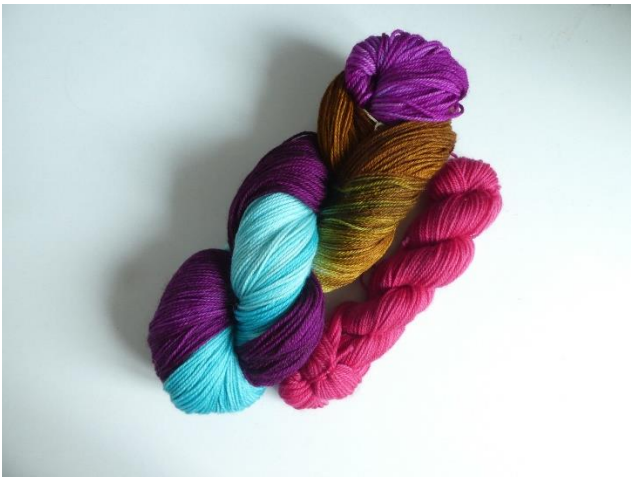
Manos del Uruguay Alegria Superpool キット、Circus 色