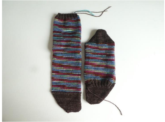
くつ下バージョンサイズ 2 のほぼ完璧なセルフストライプ