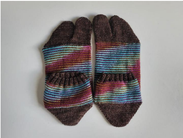
リバースタビーズ 左=パーシャル、右=トータル